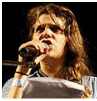
"הדור האשכנזי הצעיר לא מגיע דרך מינויים פוליטיים או שליטה בממסד הצבאי, האקדמי והכלכלי, כבעבר"